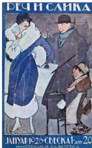
Dragoslav Stojanović, naslovna strana magazina Reč i slika , br. 1, 1926.