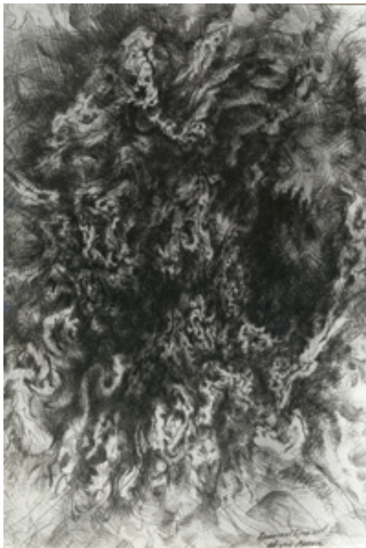
Branislav Brankov, Razbijene forme , (crtež), početak 80-ih godina 20. veka, Fotografija: Petar Radojević

ravnodušno pluta u slepom i gluvom svemiru s ostalom tvari s kojom deli isti okamenjeni očaj. Traumatizmi, fantazmi s njihovom teskobom ostaju deo jednog duboko ličnog utiska kome se možemo približiti samo uvažavanjem njegovog pravog izvora: „Nema više 'uspomene putovanja' već 'impresije putovanja'. I to u etimološkom značenju: utisnuti, istaknuti znak, impresija kao mesto utiska (dojma, osećaja). Pariska škola (ili ono što se pod tim imenom podrazumeva) da bi osujetila nasilje implicira jedan 'apstraktni impresionizam' koji se ideološki izgrađuje iz impresionizma i njegove garniture.“ (Fournet 1988,198)