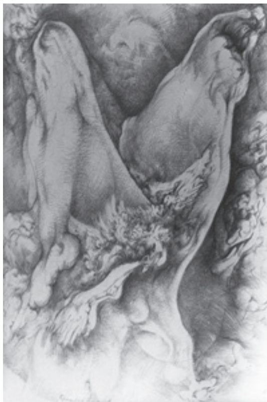
Branislav Brankov, Iz ciklisa Had , (crtež), početak 70-ih godina 20. veka

Iskustva poetske fantastike i nekih ogranaka nove figuracije išla su mu u prilog u smislu aktuelnosti premda se grčevito držao crtačkog postupka kojim je osujetio veću pažnju na svoj rad. Sredinom sedamdesetih počinje ozbiljnije da slika i radi pastelima, ali i dalje svu energiju poklanja crtežu. Uporedo s ciklusom Had , tokom osme decenije, nastaju rascvetavajuće forme s karakterističnim tamnim akcentima koje sugerišu jedan poseban odnos prema živim organizmima predlažući, umesto rađanja ili raspadanja, i jedno i drugo: hibrid, stanje najbliže mutaciji koja objedinjuje smrt i rađanje. Ova mutacija doživljava svoj vrhunac u nemuštoj ekstazi lišenoj krika oslobađanja, tragično zarobljenoj u beznadežnim šupljinama, crnim pukotinama deformisanih oblika. Radovi iz ove velike serije variraju od umekšanih, lirskih prizora baršunastih krošnji ili razređenih oblaka na laganom vetru, preko rascvetavanja