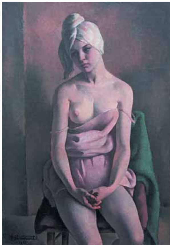
Veljko Stanojević, Devojka sa turbanom , 1928, ulje na platnu, 116 x 81 cm, Muzej savremene umetnosti, Beograd

Osnovna karakteristika svih ženskih portreta Veljka Stanojevića nastalih posebno tokom dvadesetih godina 20. veka je geometrijska stilizacija prirodnih oblika koji se pretapaju u diskretno neoklasicističku formu, preuzimajući od kubizma samo „ukus zdrave konstrukcije“ 16 . U tom duhu nastale su njegove najreprezentativnije predstave žena, slike: Devojčica pri toaleti , Sudopera (1929) i Devojka sa turbanom (1928). One odaju kompoziciono lako postignutu uravnoteženost u prostoru, odlike dekorativnosti, harmoniju hladne palete boja s težnjom za ujednačenim tonom, primenjenu na predstavama ženskih figura zauzetih intimnim, domaćim poslovima, izazivajući kod posmatrača „reminiscencije holandskog ognjišta i likovnih primesa flamanskih i staronemačkih slika iz života svetih“ 17 .