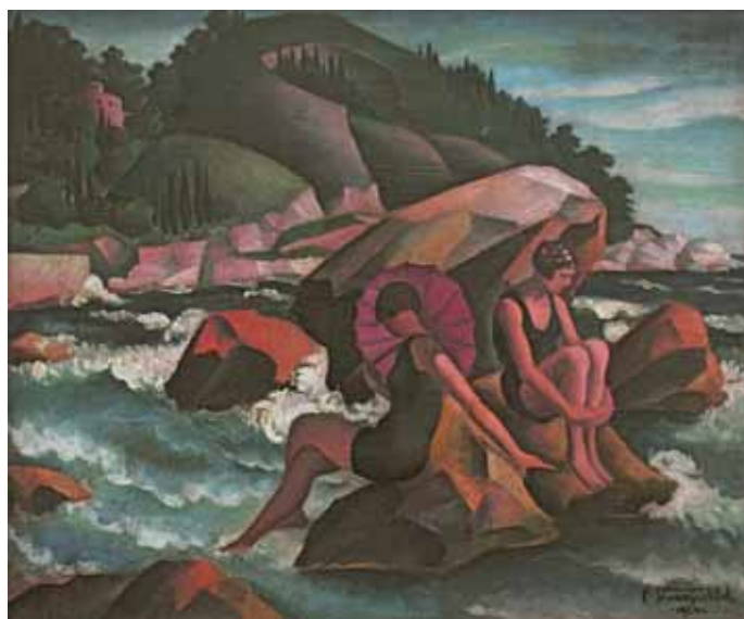
Veljko Stanojević, Kupačice , 1924, ulje na platnu, 54 x 64 cm, Muzej savremene umetnosti, Beograd

Osim stilske određenosti, portreti Veljka Stanojevića mogu da se čitaju na više nivoa. Pored izražene zainteresovanosti za lepotu žene, umetnik je delovao kao hroničar svoga vremena i modernog društva u kojem je živio. Ženski likovi koje je Stanojević slikao bili su često poznate ličnosti koje su obeležile društveni život svog vremena, predstavljene u odeći koja nam ukazuje na životni stil, društveni status, kao i na modu koja je vladala u građanskom društvu međuratnog Beograda. Modni detalji, pomodne frizure i odeća, kao i figure postavljene u zanimljiv enterijer sa detaljima poput zanimljivog nakita, nameštaja ili kaveza sa pticama, kao na portretu Devojčica s pticama (1921), predstavljaju pravi ekvilibrijum srpskog međuratnog građanskog društva. Na slici Kupačice (1924) umetnik je prikazao i