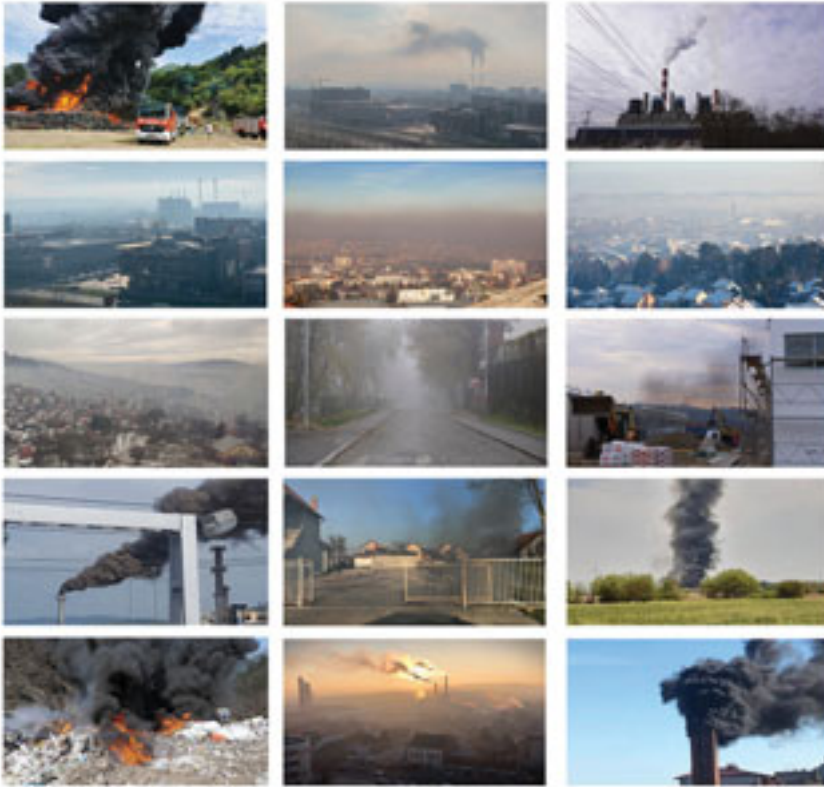
Marija Marković, I want you to panic , 2021, različito autorstvo, fotografije ustupljene umetnici, vlasništvo umetnice

konkretnih zagađivača, kao i spoljašnji, urbani i prirodni prostori na kojima je okom vidljivo zagađenje vazduha oličeno u gustom smogu karakterističnom za zimske mesece. Većinu njih je snimila umetnica, dok su ostatak ustupili pojedinci koji su svoje fotografije delili na društvenim mrežama ili sa aktivističkim grupama. Takođe, smenjuju se brzinom od 120 snimaka u minuti, što predstavlja minimalan broj otkucaja srca tokom panične epizode, dok se zvuk otkucaja srca gradacijski i dramatično ubrzava i intenzivira tokom trajanja videa, odražavajući doživljaj i stanje takozvane ekološke anksioznosti, fenomena koji je prepoznat u savremenom društvu i koji je Američka psihološka asocijacija okarakterisala kao hronični strah od klimatske katastrofe (Clayton et al. 2017, 68). Sadržaj mantre koju naratorka izgovara nagovara slušaoca da se, uprkos očiglednom lošem kvalitetu vazduha, fokusira na disanje i skoncentriše na dostizanje unutrašnjeg mira. Ironično, osveščivanje sopstvenih čula, koje ova vođena meditacija pruža, otkriva žmurenje pred zagađenjem koje je golim očima vidljivo, insistiranje na aktivnom disanju kada za tako nešto ne postoje uslovi i usmeravanje na takozvani „pogled ka unutra”, ignorisanjem svega onoga što se dešava spolja. Na taj način, ovaj rad ukazuje na problematične aspekte „velnes” kulture neoliberalnog kapitalizma, koja