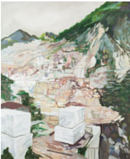
Lidija Delić, A long time , 2022, foto Marijana Janković, vlasništvo umetnice

2022). On ne samo da ističe ekstraktivizam kao suštinu ovog odnosa, već ukazuje i na kontrast između onoga o čemu se govori kao o vremenu Geje i antropocena (Latour 2015, 47–48; up. Zec 2022, 26–28), odnosno na drastičnu razliku između geološkog vremena koje je bilo neophodno za formiranje mermerne stene i neupo-