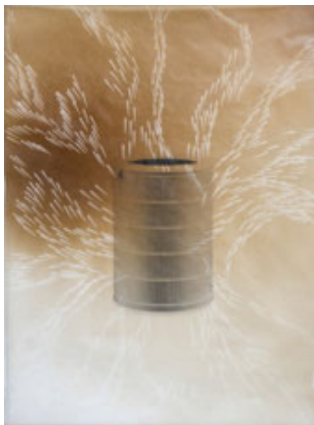
Marija Marković, Ridiculous objects , 2021, foto Marija Marković, vlasništvo umetnice

Pored toga što otkrivaju nedostatke koji postoje u samom društvu, ovakvi radovi ukazuju na problematične strukture i strategije koje, posmatrano u širem, političko-ekonomskom, globalnom kontekstu, predstavljaju generatore problema koji se tiču klimatskog sloma. Kada je reč o tome kako se ovi radovi pozicioniraju u spektru odrednica, kriterijuma ekološke umetnosti, može se izvesti više zaključaka. S jedne strane, Želim da paničite ispunjava zahtev da se umetničkim praksama osveščuju i dodatno potcrtavaju vladajući problemi klimatskog sloma, kao i da se to čini posredstvom sopstvenih načina i metoda, odnosno svojstvenog umetničkog jezika (Schneider 2021, 265). Takođe, navedeni radovi Marije Marković ne spadaju u domen aktivističkih radova, niti su sami po sebi ekološki izvedeni, odnosno od ekoloških materijala ili određenom zelenom metodologijom gde bi se pazilo na karbonsku neutralnost. Međutim, oni ukazuju na spregu i međupovezanost koje postoje između ekologije i ostalih sistema, na društvenu i klasnu uslovljenost naše