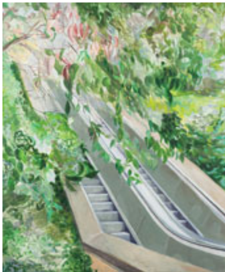
Lidija Delić, A moment ago , 2022, vlasništvo umetnice

Na prvi pogled, fokus u tom odnosu je na čoveku. Diptisi predstavljeni na izložbi With luck, there'll be no more dreams (Galerija Eugster, Beograd, 2021) kombinuju isečke enterijera, prirode i svakodnevnih ljudskih rituala, poput obedovanja, kao vid beleženja detalja sveta i života kakav uskoro možda više neće postojati. Ova idejna linija dalje se razvija kroz sliku A moment ago (2022) sa centralnim motivom stepeništa uz koje kao da se više niko ne penje, a nad kojim se sve više nadvija bujno rastinje, preko slika Time of Risk (2022) i Take your time (2022) koje predstavljaju enterijere u kojima je ljudsko odsustvo naglašeno velikim brojem praznih stolica koje čekaju da neko sedne na njih ili sa kojih kao da je neko nedavno ustao. Kulminaciju predstavlja instalacija In a Silent way , prikazana na izložbi Still, life (Galerija Alba, Beč, 2023), sa video-radovima koji najjasnije ukazuju na ideju prirode koja postepeno preuzima i nadvladava napuštenu arhitekturu, destruktivno prodirući u nju. Svi ovi radovi upućuju na ideju trajnog nestanka ljudskog roda usled kolapsa čiji se karakter ne precizira, ali se pretpostavlja da je klimatskog tipa (up. Zec 2022, 28), a zbog čega se mogu čitati kroz osećanje zabrinutosti i straha od smrti i nestanka – ali samo ljudi,