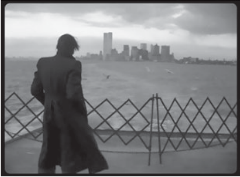
Zoran Popović, Struggle in New York—Борба у Нјујорку , 1976. 16 mm, kadar

Sniman u Njujorku u oktobru i novembru 1976, Popovićev film premijerno je prikazan 27. aprila 1977. u beogradskom Studentskom kulturnom centru i od tada je imao niz projekcija u Jugoslaviji i širom sveta, poslednjih godina u galeriji Tate Britain u Londonu (2016) i Muzeju savremene umetnosti u Beogradu (2017), da bi napokon, posle višedecenijskog zakašnjenja, film dobio i njujoršku premijeru sa projekcijom u Muzeju moderne umetnosti (MoMA), 27. aprila 2019. godine. Ovako veliki vremenski zazor između snimanja i prikazivanja filma u Njujorku iznenađuje tim više što ovaj film predstavlja jedinstven umetnički rad koji svedoči o politizovanoj konceptualnoj umetnosti u ovom gradu tokom sedamdesetih godina. Ipak, bilo bi pogrešno reći da se radi o dokumentarnom filmu. Borba u Njujorku je film umetnika koji koristi dokumentarizam kao jedan od niza metoda zastupljenih u njemu. Ova raznovrsnost potiče od kompozicionog pristupa. Film se sastoji od 11 individualnih segmenata na kojima je radilo preko dvadeset umetnika, kritičara i aktivista sa njujorške alternativne scene iz sedamdesetih. U središtu ovog umetničkog, ali i društvenog, kruga je već pomenuti ALNY. U prvom segmentu, naslovljenom „International Local”, Džozef Kosut, Sara Čarlsvort i Entoni Mekol (Joseph Kosuth, Sarah Charlesworth, Anthony McCall) izlažu osnovni princip saradnje na kome je film zasnovan: