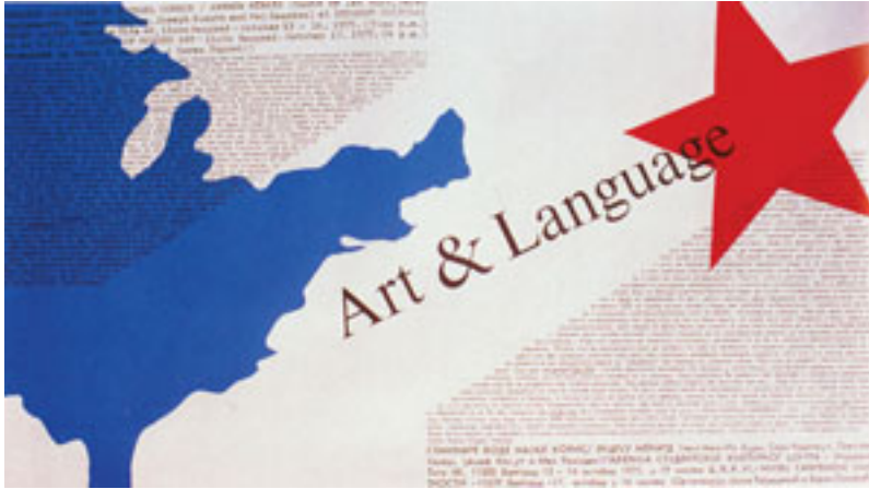
Poster za seminar Art & Language u Studentskom kulturnom centru, Beograd, 13–16 oktobar 1975.

kritiku, oni odgovaraju da je umetnost osuđena na reprodukciju društvene klasne strukture. Nemajući kud dalje, Aleksić podseća na nužnost estetike, pozivajući se na hegelovsku ideju o kraju umetnosti. Njegovi sagovornici nisu bili sasvim ubeđeni: