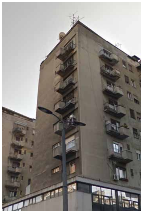
Branislav Marinković, Stambeni soliteri, Bulevar despota Stefana 66–68, 1957.

U prizemlju su pozicionirani lokali, garderobe osoblja, magacini, kancelarije, dvosoban stan za nastojnika zgrade, a po spratovima je 28 stanova, od kojih su posebno osmišljeni komforni trosobni stanovi sa dečjim sobama. Na povučenom osmom spratu Marinković je predvideo perionice, sušionice i toalet. Konstruktivni sistem sastoji se od armirano-betonskog skeleta sa ispunom od šuplje opeke, dok su međuspratne konstrukcije livene armirano-betonske. Pregradni zidovi su od šuplje opeke u kombinaciji sa cementnim malterom. Kao i na stambenoj zgradi na uglu Studentskog trga i Vasine, Marinković je posebno tretirao ulaze,