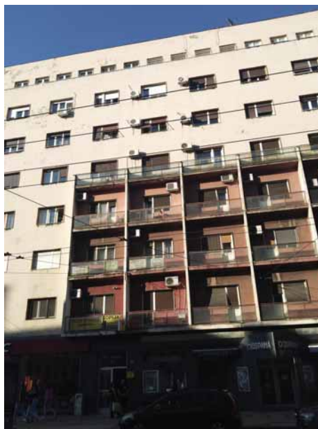
Branislav Marinković, Stambena zgrada, ugao Vasine ulice i Studentskog trga, 1952.