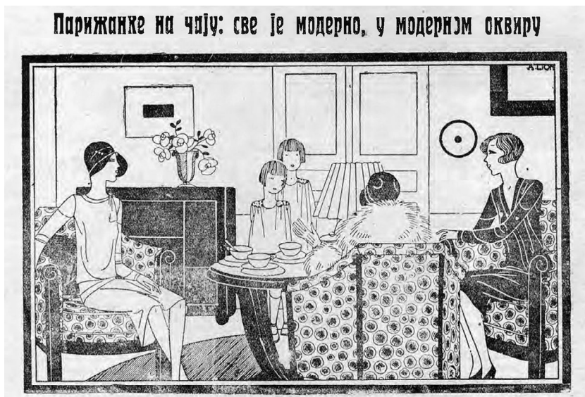
Slika 1. Ilustracija, Žena i svet 2, 1929.