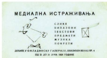
Pozivnica za izložbu Medialna istraživanja , Arhiv Fonda Olge Olje Ivanjicki, Beograd

Izložba Medialna istraživanja organizovana je 21. juna 1958. godine, sa početkom u 19 časova, u Omladinskoj galeriji na Obilićevom vencu br. 4, u Beogradu. 1 Kao datum zatvaranja na jednoj pozivnici se navodi 31. jun, iako brojna istoriografija beleži da je to bio 9. jul. 2 Na dve pronađene pozivnice 3 iščitavamo da su umetnici na izložbi pokazali svoja medialna istraživanja: slike, pipazone, tekstove,