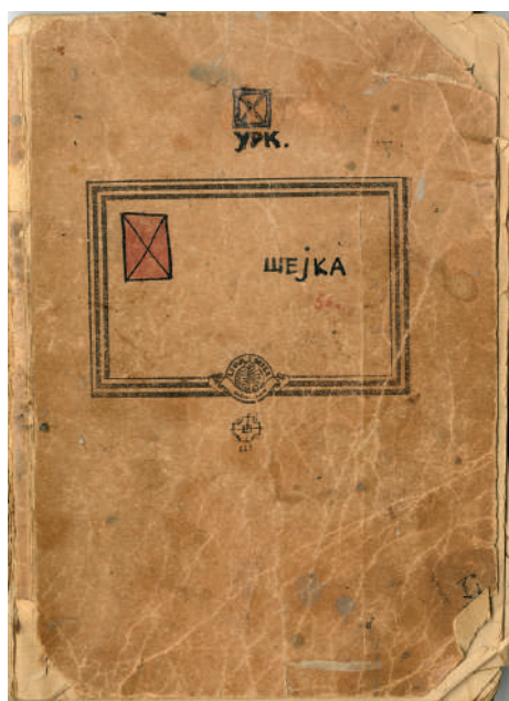
Leonid Šejka, Knjiga-objekat br. 3 URK, naslovna stranica

Najpre kod Leonida Šejke konstatujemo da osim uvođenja neumetničkog predmeta (umetnost gubi auru) imamo njegovo destabilizovanje statusa i zamenu predmeta iskustvom (sistem Kvarture , Akcije na đubrištu ), što u sebi inkorporira i dokumentovanje kao deo umetničkih aktivnosti. Amorfne multiplikacije i Objekti kao slike , osim razaranja estetike, polemišu sa ulaskom masovne proizvodnje i potrošnje u svet umetnosti, čime se dodatno potkopava originalnost umetničkog predmeta. Leonid Šejka je fotografski dokumentovane, ili samo kao deo usmenih svedočenja, svoje akcije izvodio zajedno sa Vladanom Radovanovićem, što možemo tumačiti kao prethodnicu performansa. Jedno od prvih izvođenja takve zajedničke akcije dogodilo se na leto, u predgrađu Beograda, još 1956. godine. Na proleće 1958.